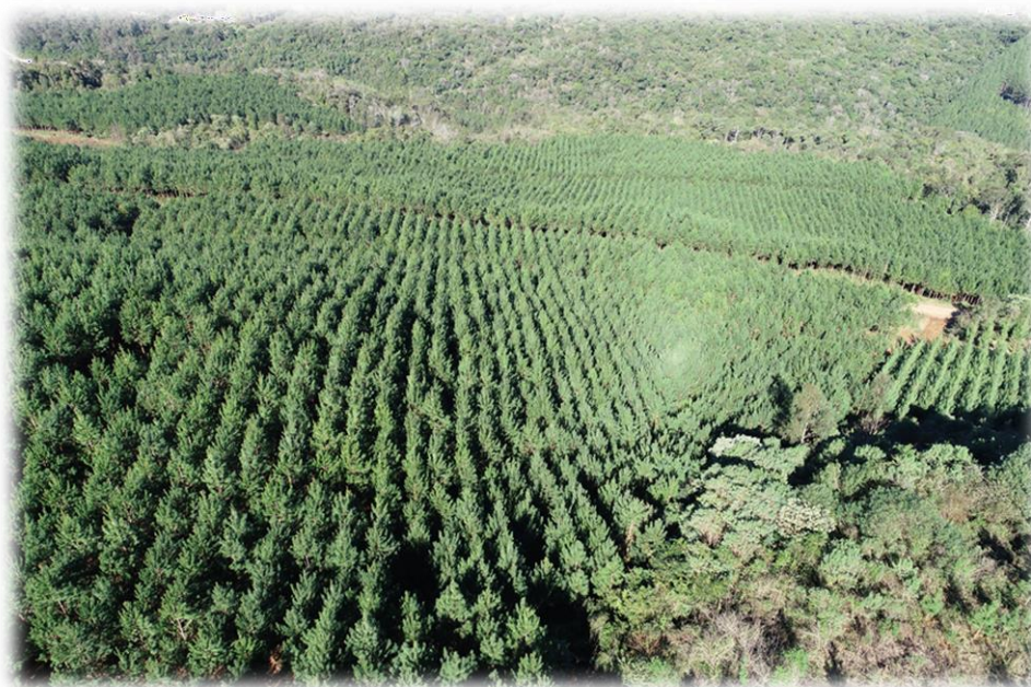
Figura 6- Imagem aérea com plantio florestal.

O Inventário Florestal tem por objetivo o conhecimento quantitativo e qualitativo dos indivíduos que compõe as fazendas da empresa, a partir da alocação de amostras e mensuração dos indivíduos, permitindo o planejamento do uso dos recursos florestais.