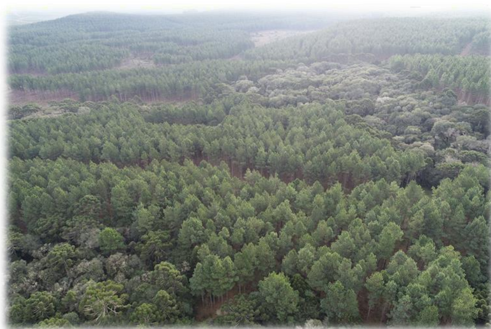
Figura 4 – Detalhe de áreas florestais da Bragagnolo Florestal.