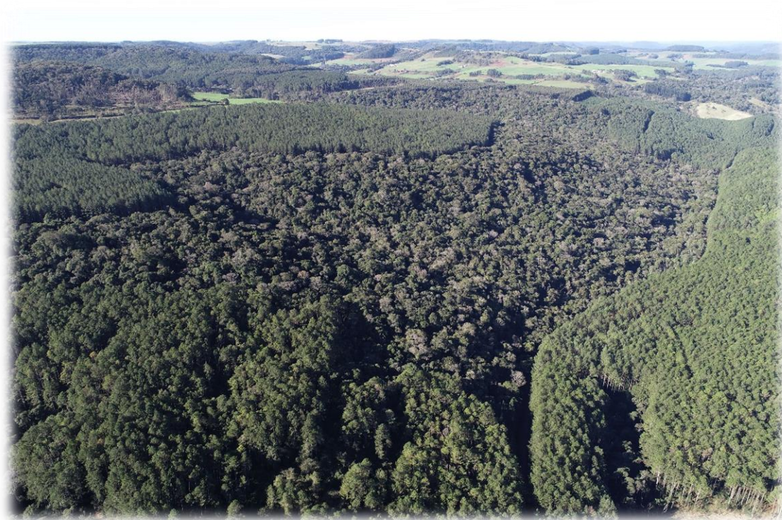
Figura 7 - Imagem aérea com a presença de remanescentes naturais e floresta plantada.

A Braagnolo Florestal apresenta área total superior a 2.000 ha e destes, aproximadamente 800 ha são compostos por remanescentes naturais, os quais são preconizadas para sua manutenção e conservação.