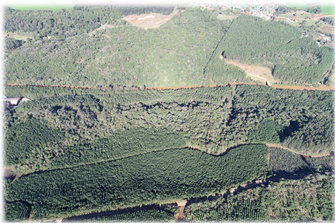
Figura 9 - Imagem aérea das áreas de plantios florestais e remanescentes de vegetação natural.

Não foram identificados atributos que configurassem em Áreas de Alto Valor de Conservação.