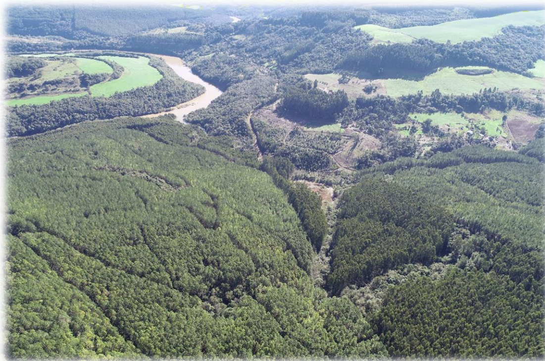
Figura 2 - Imagem aérea detalhando áreas da Bragagnolo Florestal.

A Bragagnolo possui oito áreas que estão no escopo da certificação, sendo que quatro delas são operadas por meio de parceria. As fazendas (Unidades de Manejo Florestal-UMF) estão localizadas nos municípios Vargeão, Faxinal dos Guedes, Luzerna, Ponte Serrada e Herval D'oeste.