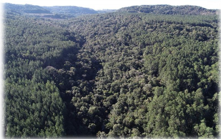
Figura 8 - Detalhe de APP em área da Bragagnolo Florestal.

Para informação e conscientização dos colaboradores, são dadas informações e treinamentos demonstrando as principais medidas que a empresa adota para proteção da fauna e flora, recursos hídricos e remanescentes naturais.