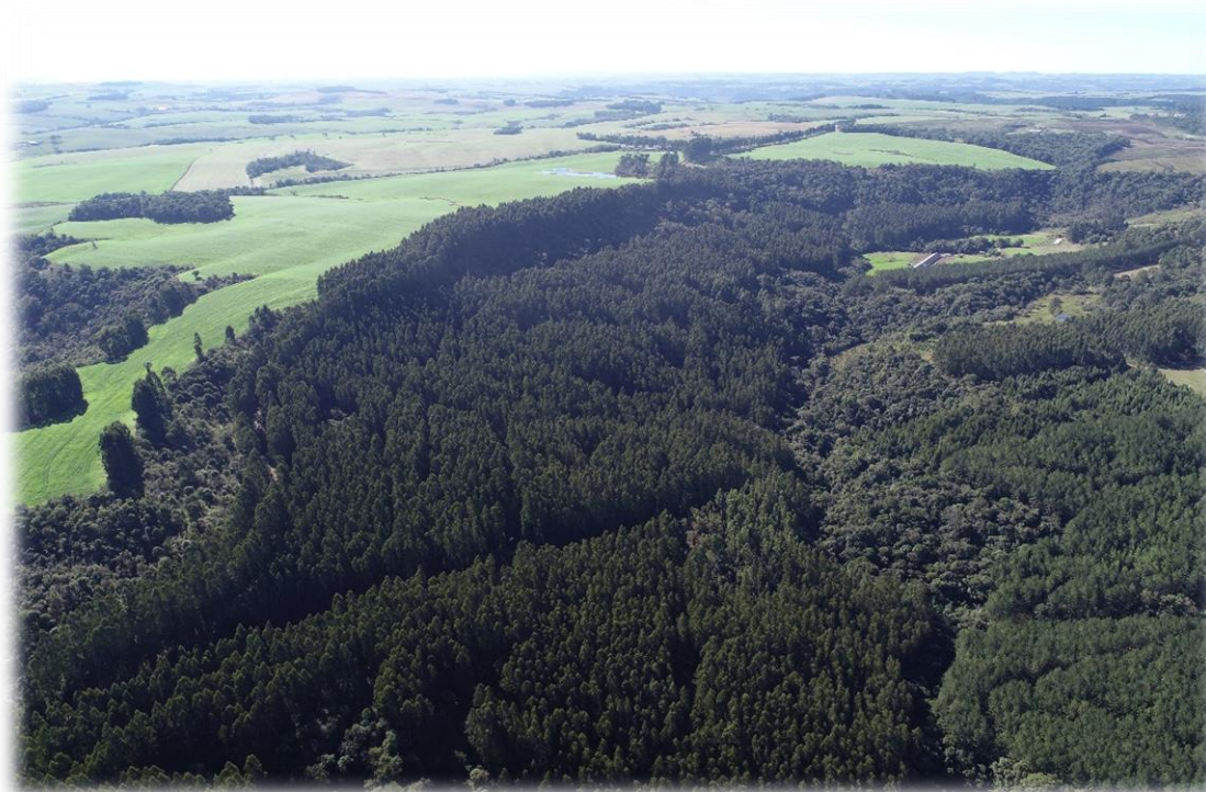
Figura 1 - Imagem aérea de florestas da Bragagnolo Florestal e remanescentes de vegetação natural.

Na década de 90 iniciou-se o plantio de milhares de pés de eucalipto, tendenciado pelo movimento do mercado, escassez de madeiras duras como imbuía e canela, juntamente com a proibição de derrubadas de árvores nativas. Atualmente, administra cerca de 1.700 ha de florestas próprias, e aproximadamente 660 ha de florestas em regime de parceria em áreas arrendadas, com idades variadas.