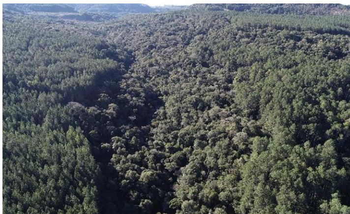
Figura 8- Detalhe de APP em área da Bragagnolo Florestal.