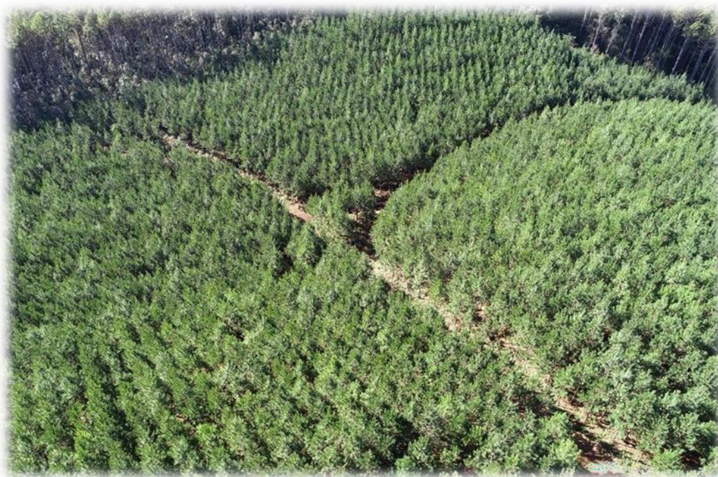
Figura 5- Imagem aérea de área florestal com área plantada em formação.

As espécies escolhidas para serem manejadas pela empresa integram o gênero Pinus , Eucalyptus e algumas frações de áreas com Araucárias. Dentre as espécies de Pinus , destaca-se, enquanto principal espécie, o Pinus taeda . Mas também há em alguns plantios e condução de Pinus elliottii e Pinus patula e outros com o gênero Eucalyptus , como as espécies Eucalyptus benthamii , Eucalyptus dunnii , Eucalyptus viminalis e Eucalyptus grandis .