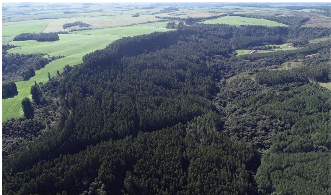
Figura 1- Imagem aérea de florestas da Bragagnolo Florestal e remanescentes de vegetação natural.

Na década de 90 iniciou-se o plantio de milhares de pés de eucalipto, tendenciado pelo movimento do mercado, escassez de madeiras duras como imbuía e canela, juntamente com a proibição de derrubadas de árvores nativas. Atualmente, administra cerca de 1.700 ha de florestas próprias, e aproximadamente 660 ha de florestas em regime de parceria em áreas arrendadas, com idades variadas.