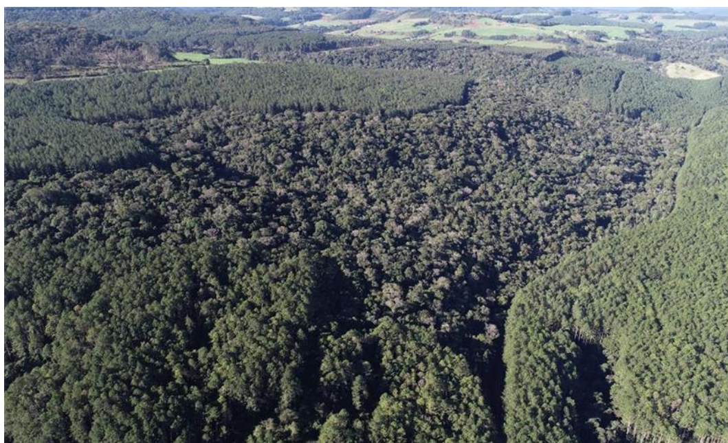
Figura 7- Imagem aérea com a presença de remanescentes naturais e floresta plantada.

A Braagnolo Florestal apresenta área total superior a 2.000 ha e destes, aproximadamente 800 ha são compostos por remanescentes naturais, os quais são preconizadas para sua manutenção e conservação.