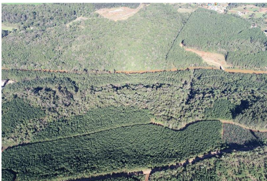
Figura 9- Imagem aérea de plantios florestais e remanescentes de vegetação natural.

Não foram identificados atributos que configurassem em Áreas de Alto Valor de Conservação.